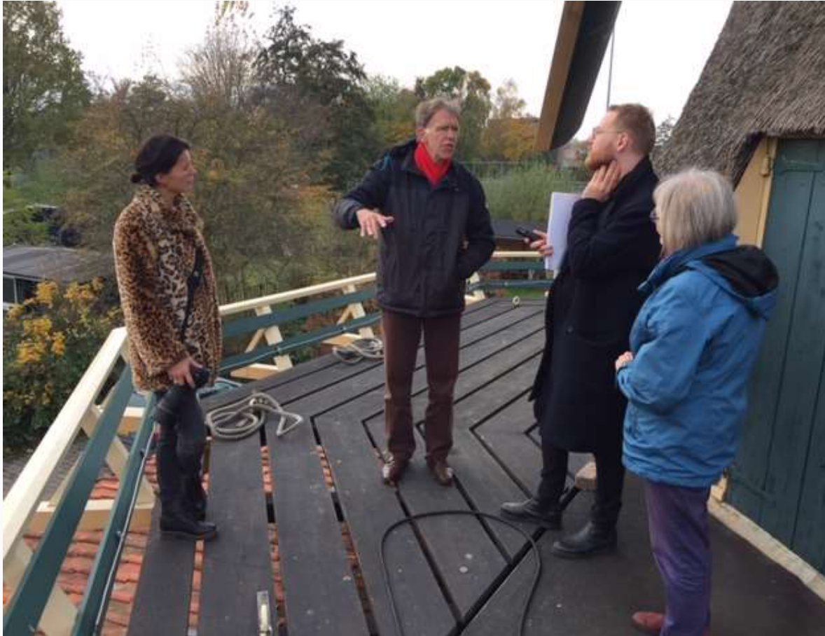
Foto 1809: Verslaggever en fotograaf vna de Volkskrant kijken naar de biotoop