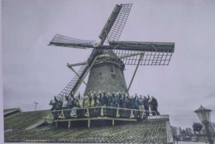
Krijtmolen d'Admiraal november 2017, met molenaars uit heel Nederland op de omloop, na afloop van landelijke evenement bij de officiële bekendmaking dat het ambacht van Molenaar opgenomen is in de UNESCO Werelderfgoedlijst.

Krijtmolen d'Admiraal is de enige nog werkende krijtmolen ter wereld. Het belang van instandhouding van dit cultureel erfgoed wordt gezien door de actieve groep molenvrienden, vrijwilligers en bestuurders, en onderstreept door de vele honderden bezoekers tijdens de Open Molen- en Monumentendagen. Voor een molen is een goede windvang en regelmatig draaien en malen als ademen en bewegen voor een mens. Zowel dit Rijksmonument als de vrijwilligers verdienen meer steun dan de gemeente Amsterdam nu biedt.